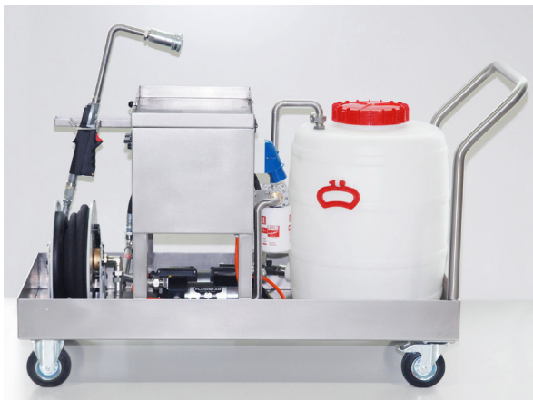
Kompl. Einheit vorkonfektioniert