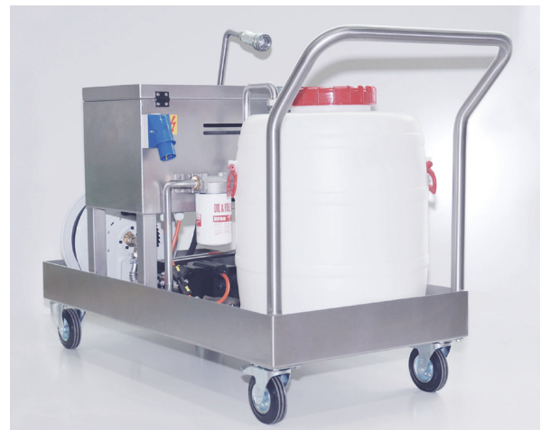
Kompl. Einheit vorkonfektioniert

Wir sorgen für einen zuverlässigen und umweltverträglichen Betrieb.